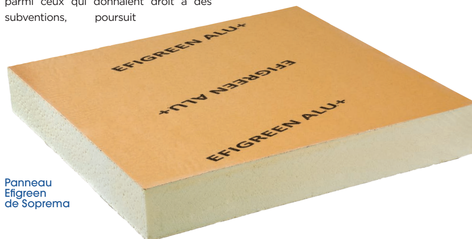
Panneau Efigreen de Soprema