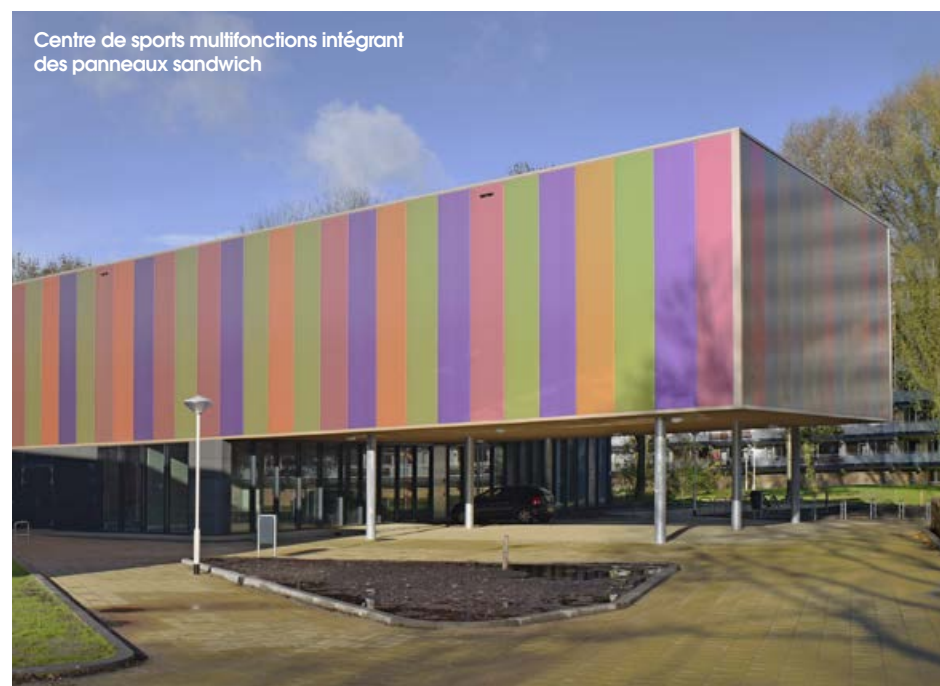
Centre de sports multifonctions intégrant des panneaux sandwich

Nous travaillons de concert avec le Syndicat Enveloppe Métallique du Bâtiment, dont notre activité dépend, et l'ACERMI pour finaliser un règlement propre aux panneaux sandwich qui s'appellera RP 17 et nous permettra le passage à un référentiel classique intégrant d'autres caractéristiques certifiées en plus de la résistance thermique. Ici, le nom Tremplin porte bien son nom !