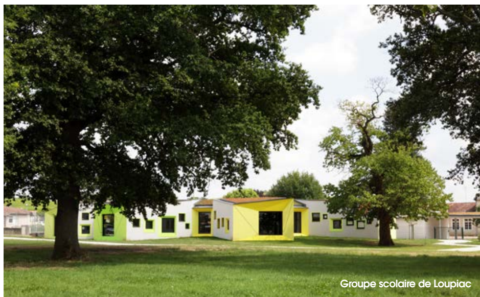
Groupe scolaire de Loupiac

Julien Gadrat développe son activité dans l'ensemble des domaines de la construction. Il propose une architecture contextuelle requestionnant les usages et une nouvelle lecture des programmes pour réaliser des bâtiments innovants, respectueux et généreux.